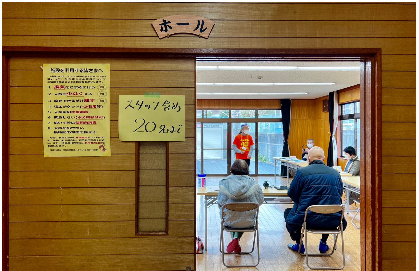
写真. 2021年度の健康チェックのご様子