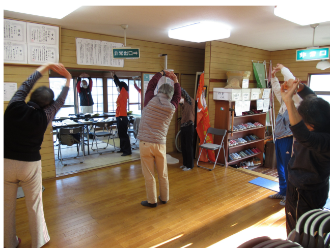
写真. 健康チェック時に感染症対策を徹底し、準備体操運動を行う皆さまのご様子