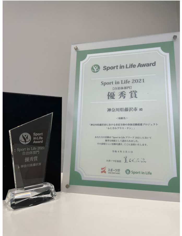
図2. 賞状及びトロフィー

これには皆さまの参加が欠かせない成果であり、私たちとしては引き続き、運動を通じて皆さまの健康づくりにご協力させていただきたいと思っております。