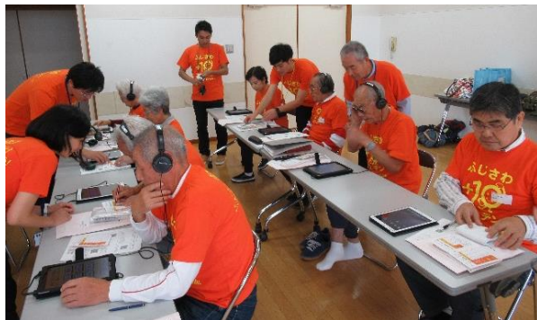
スポーツ吹き矢歩楽吹クラブさん 2019年10月21日