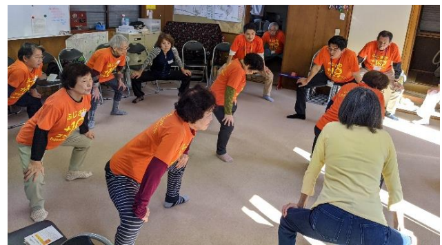
辻堂東町婦人部さん 2019年11月19日