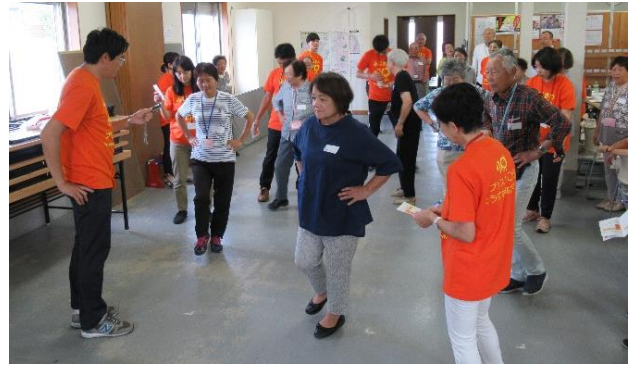
柄沢北部喜楽会さん 2019年10月8日