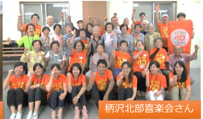
柄沢北部喜楽会さん