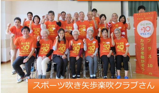
スポーツ吹き矢歩楽吹クラブさん