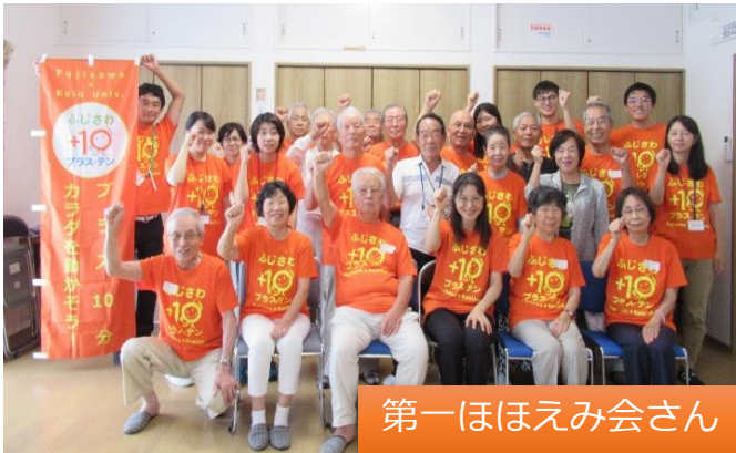
第一ほほえみ会さん