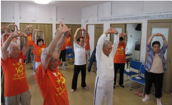
第一ほほえみ会さん 2019年10月8日