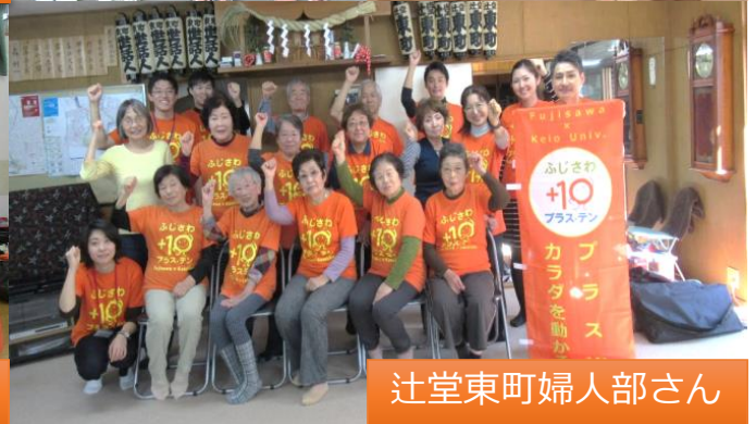
辻堂東町婦人部さん

ふじさわプラス・テンの4年後健康チェックにご協力頂いた皆様 (2019年10~11月)